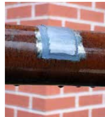
Aplicación sobre superficies húmedas o contaminadas con aceite