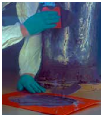
Aplicación bajo el agua