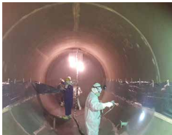
Aplicación de Belzona 1391S usando pulverización

Si necesita más información, comuníquese con el representante de Belzona de su localidad: